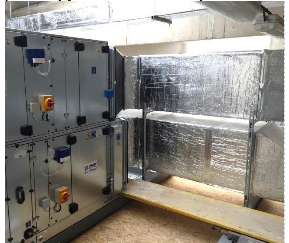
Prípravil: Ing. Ľuboš Socha, Ph.D.

Chladienie dvoch kancelárskych priestorov zabezpečujú dve vnútorné 3,5kW jednotky Mitsubishi a jedna 7,5 kW vonkajšia jednotka. Predbežný termín ukončenia a spustenie do prevádzky je v 36. kalendárnom týždni 2017.