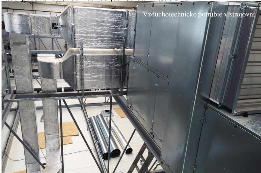
Vzduchotechnické potrubie v strojovni

Naša spoločnosť realizuje vetranie priestorov Eat Happy na Technickej ulici č.7 v Bratislave. Distribúciu vzduchu zabezpečujú tri vzduchotechnické jednotky Hřebec o celkovom objeme vzduchu: 12 000 m 3 /hod. Optimalizovanie teploty privádzaného vzduchu je zabezpečované kondenzačnou jednotkou Mitsubishi.