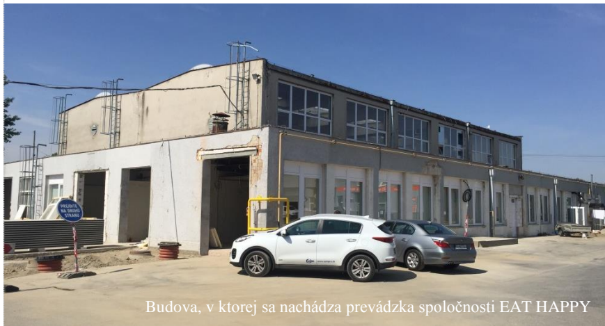
Budova, v ktorej sa nachádza prevádzka spoločnosti EAT HAPPY

V mesiaci august realizujeme vetranie priestorov budúcej výrobnéj prevádzky spoločnosti EAT HAPPY, ktorú zastrešuje developer ALFA-GROUP International.